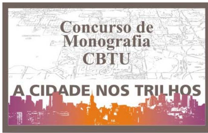
Figura 2: Logomarca do concurso

A Figura 2 apresenta a logomarca do concurso.